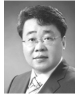
이 한 성

Class of ART Algorithms," International Computer Science Institute, TR 98-004, 1998.